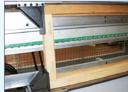
barra griglie sdoppiata a passo variabile bar in two parts with variable pitch