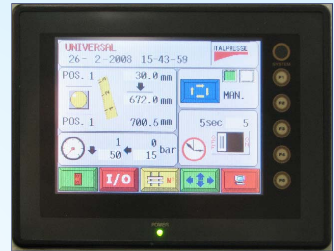
Interfaccia computerizzata per il controllo assi "TS/500" 'Touch-screen' operator interface TS/500