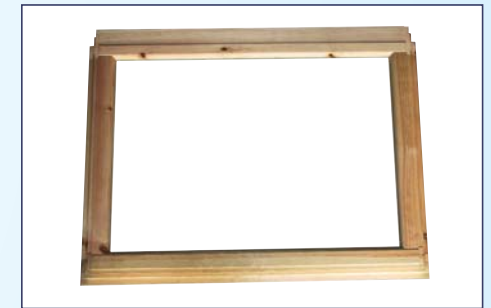
CICLI SPECIALI nel caso di telai sottili/delicati o infissi prefiniti SPECIAL CYCLE in case of light or pre-finished frames