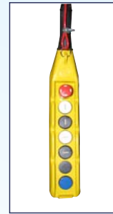
Pulsantiera pensile Hanging push-button strip